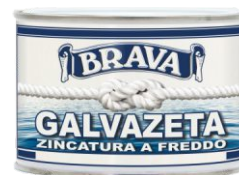
Latta da 375 ml.