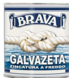
Latta da 750 ml.