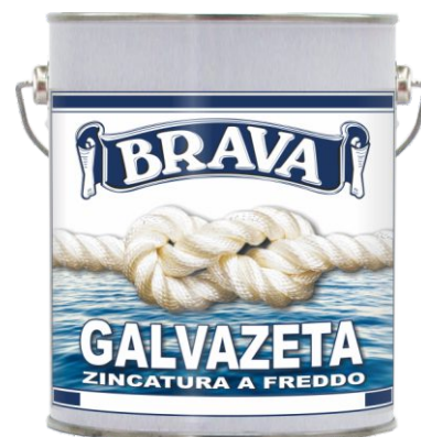
Latta da 2,5 Lt.